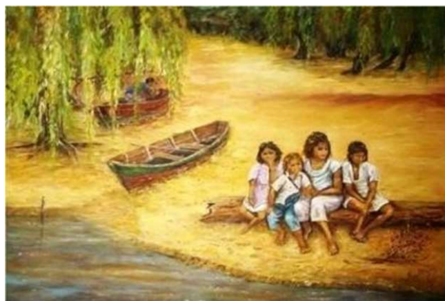
Figura 1. Óleo de Mary Beliz 1 .